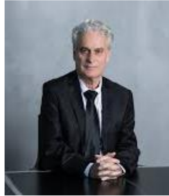
השופט בדימוס יגאל פליטמן נשיא בית הדין לעבודה לשעבר