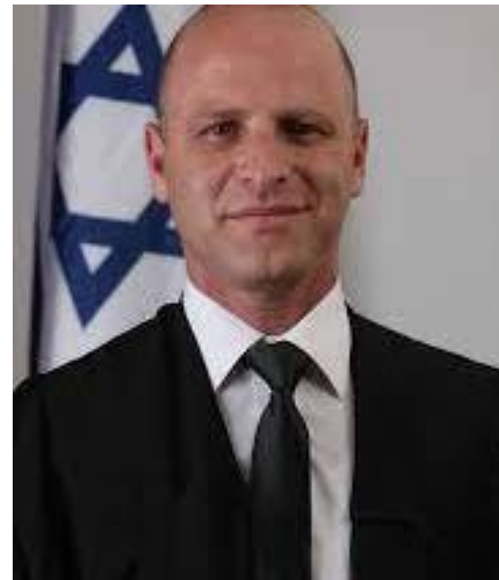
השופט צביקה פרנקל בית הדין לעבודה